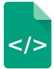
Séance 4 cube récepteur correction