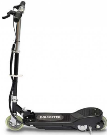
Photo de la trottinette

Une trottinette électrique ne freine plus.